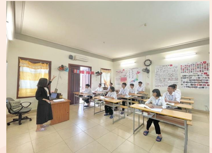
教育センター授業風景