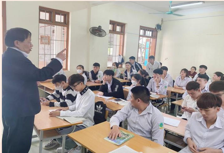
説明会・リクルートイベントの様子